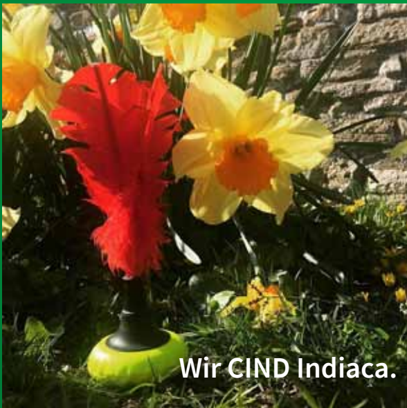
Wir CIND Indiaca.