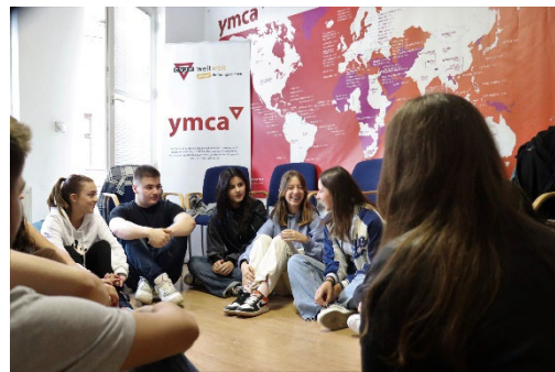
Jugendgruppe im YMCA

Der Kosovo ist ein noch sehr junger kleiner Binnenstaat im Zentrum der Balkanhalbinsel. Die Mehrheit der Bevölkerung stellen die Albaner (88%), während in dem Vielvölkerstaat die zahlenmäßig stärksten ethnischen Gruppen von Serben, Bosnier, Türken, Roma, Aschkali und Ägyptern gebildet werden. Von der Religionszugehörigkeit sind Muslime, Katholiken, Protestanten und Orthodoxe Christen am prominentesten vertreten. Der Kosovo hat 1,8 Millionen Einwohnern, von denen 70% unter 35 Jahre alt sind – die Bevölkerung gilt als die durchschnittlich jüngste innerhalb Europas.