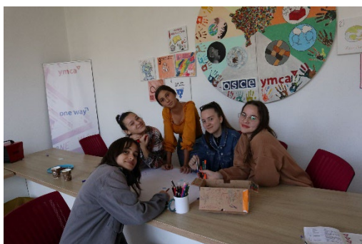
Lernen mit neuen Methoden

Die Vorbereitung der jungen Menschen auf den Beruf ist nicht optimal im Kosovo. Es steht nicht viel Geld für die Schulen zur Verfügung, es gibt nicht genug Lehrer und so kann nur rudimentärer Unterricht erteilt werden. In dieser Lücke ergreift der YMCA seine Chance. In der Hauptstadt Pristina bietet er einen zusätzlichen „grünen“ Lehrplan nach dem offiziellen Unterricht an. In der Erprobungsphase richtet er sich an 40 junge Menschen pro Jahr. Mit der Abkürzung STEAM ist die Berufsorientierung im Allgemeinen und das Erlernen von Kenntnissen im künstlerischen, technischen und mathematischen Bereich gemeint. Modernere und ganzheitliche Lehrmethoden sollen dabei eine erfrischende Alternative zu dem noch vorherrschenden schulischen Frontalunterricht bieten.